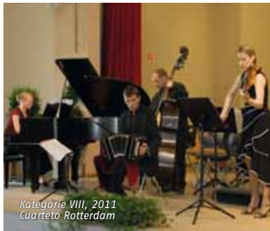
Kategorie VIII, 2011 Cuarteto Rotterdam