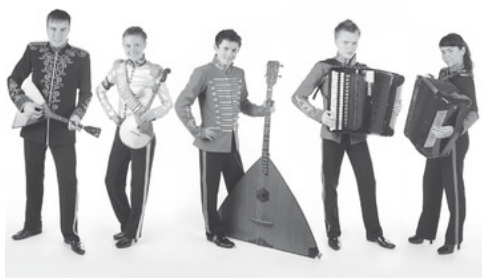
Esse-Quintett, St. Petersburg

Preisträger 2011, Internationaler Akkordeonwettbewerb Klingenthal