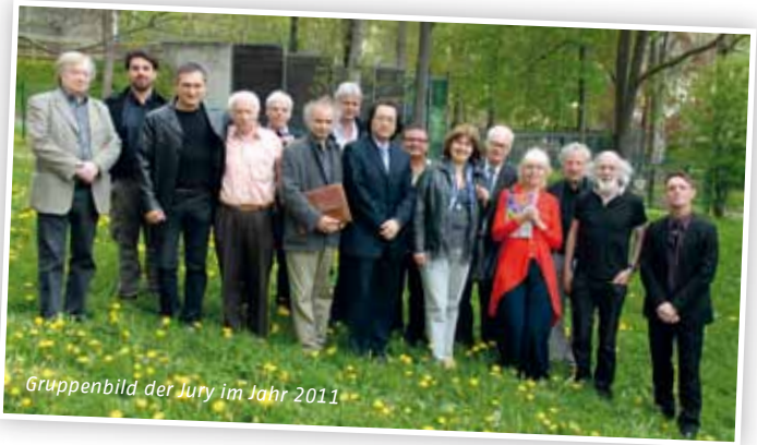
Gruppenbild der Jury im Jahr 2011