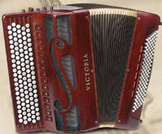
XB502c Cadenza Cassotto Converter

Models manufactured with finest acoustic woods by a real lute-maker.