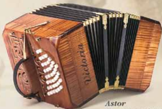
Astor Chromatic or Diatonic

Models manufactured with finest acoustic woods by a real lute-maker.