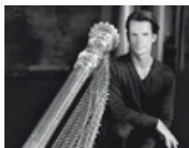
Xavier de Maistre