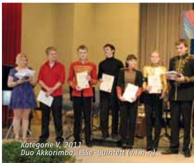
Kategorie V, 2011 Duo Akkorimba, ESse-Quintett (v.l.n.r.)