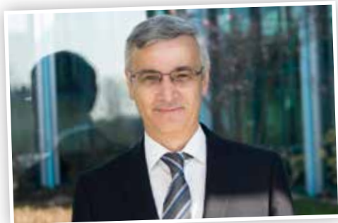
Rolf Keil Landrat des Vogtlandkreises