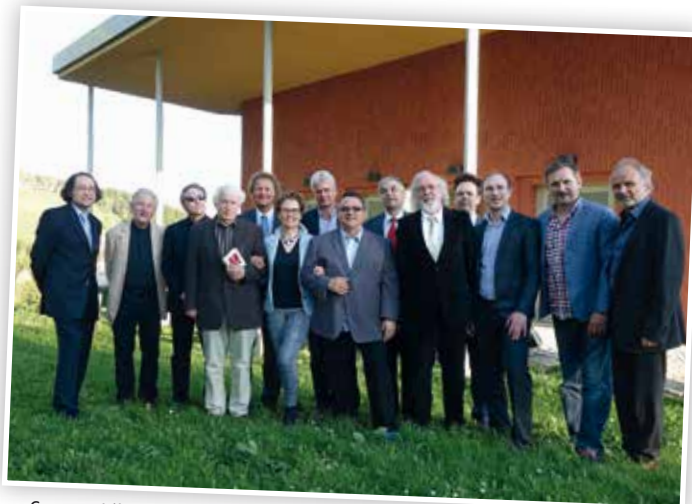
Gruppenbild der Jury im Jahr 2015