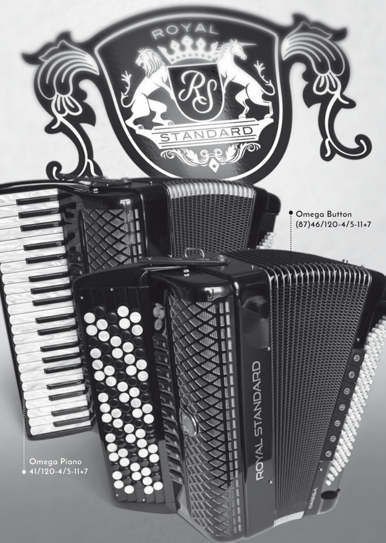
• Omega Button (87)46/120-4/5-11+7